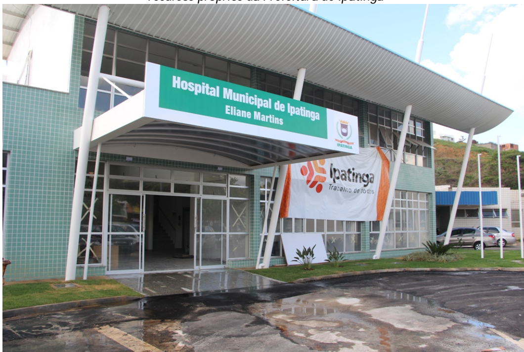
Administração municipal mantém agenda com o Estado para garantir recursos para o custeio do HMI.

Para manter o HMI em funcionamento são investidos R$ 42 milhões por ano; R$ 22 milhões são “bancados” com recursos próprios da Prefeitura de Ipatinga